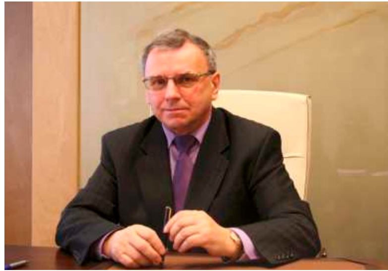
Józef Sebesta - Marszałek Województwa Opolskiego

W czwartym kwartale br. podjęliśmy ostateczną decyzję o przyznaniu środków unijnych opolskim przedsiębiorcom, których projekty uzyskały najlepsze noty w konkursach do poddziałań 1.1.2 Inwestycje w mikroprzedsiębiorstwach oraz 1.4.1 Usługi turystyczne i rekreacyjno-sportowe świadczone przez przedsiębiorstwa RPO WO 2007-2013. Pierwsze umowy z firmami zostały podpisane 7 listopada br. Ponieważ wzmocnienie potencjału