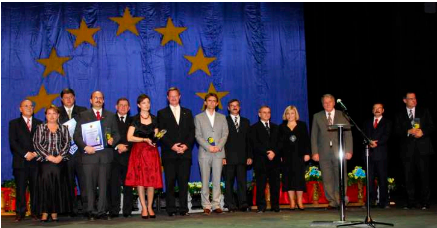
Laureaci i organizatorzy Konkursu „Opolskie Euro 2008”

Pozostali nominowani w poszczególnych kategoriach otrzymali dyplomy z wyróżnieniem w konkursie „Opolskie Euro” (A.D.)